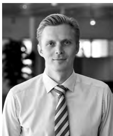
Marcus Westdahl, CEO, EFG European Furniture Group AB

”Stadig flere av oss velger alltid det miljøvennlige alternativet, forutsatt at kvaliteten og funksjonen kan garanteres. For EFG er det viktig at du har den muligheten.”